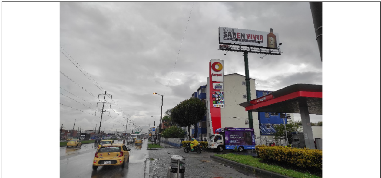
Foto 1. Vista panorámica del predio y de la valla ubicada en la Av. Carrera 68 No. 14 - 21 Sur (dirección catastral), orientación NORTE - SUR